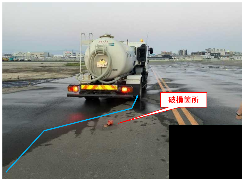
事故発生状況の再現写真