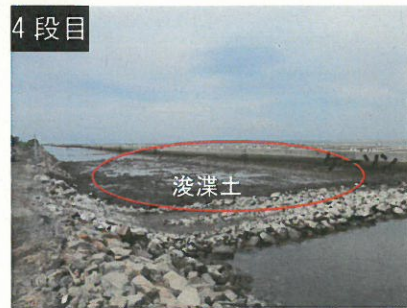
造成した干潟・浅場の状況