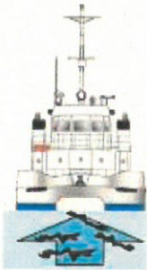
調査観測兼清掃船 「海輝」(かいき)