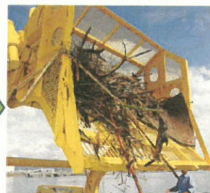
スキッパーによる回収状況