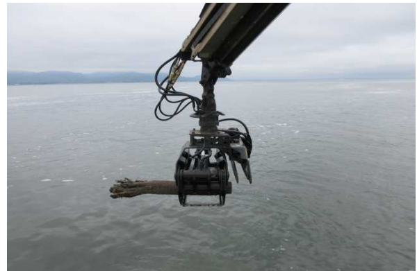
流木の回収(菊池川河口)