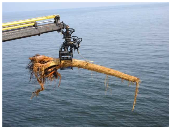
流木の回収(三池港沖)