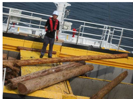
回収した流木(三池港沖)