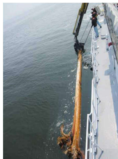
流木の回収(多比良港沖)