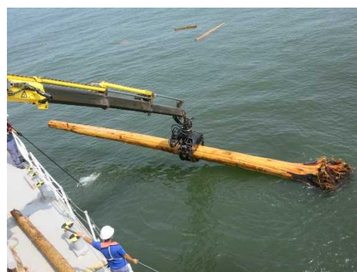
流木の回収(三池港沖)