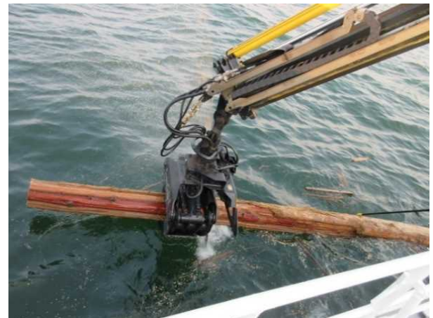
7/27 流木の回収(熊本港沖)