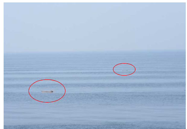
7/28 海面に浮かぶ流木(三池港沖)