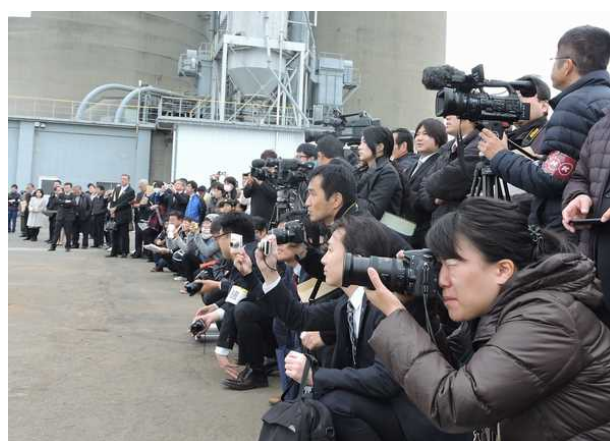
マスコミ各社の取材状況