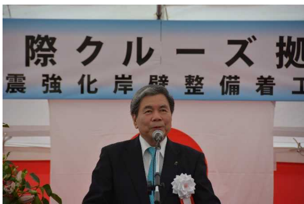
蒲島熊本県知事式辞