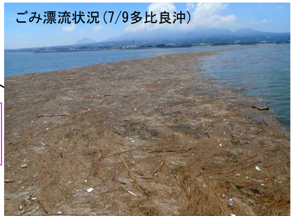
ごみ漂流状況 (7/9多比良沖)