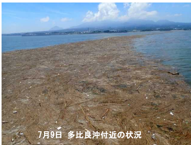
7月9日 多比良沖付近の状況