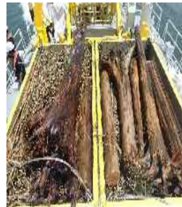
回収した漂流物で満載になったコンテナ