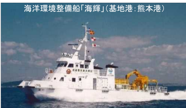
海洋環境整備船「海輝」(基地港:熊本港)