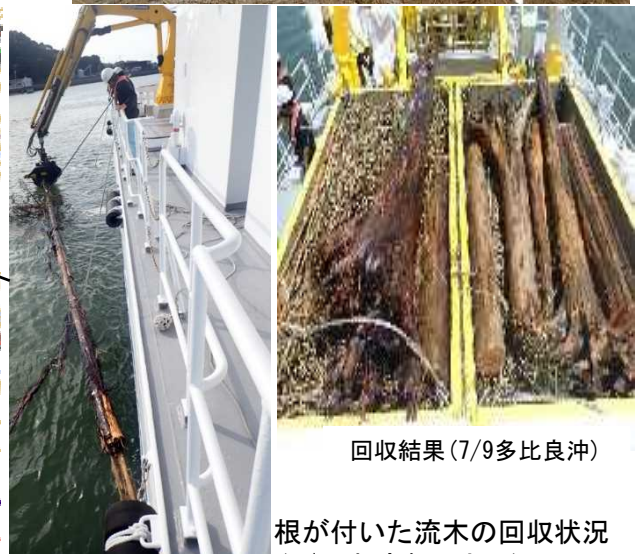
回収結果 (7/9多比良沖)