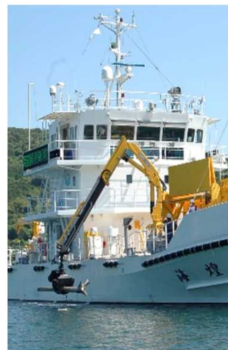
漂流ごみ回収訓練