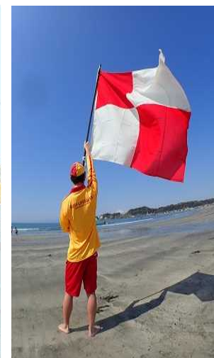
津波フラッグ避難訓練