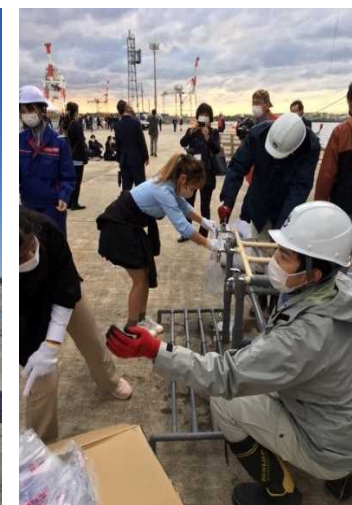
支援物資輸送訓練イメージ (2022高校生サミットin新潟のもの)