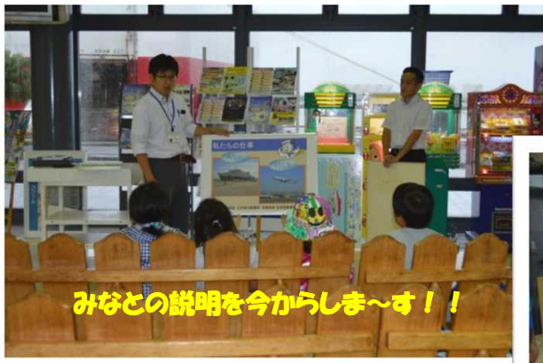
みなとの説明を今からしま〜す！！

パネルを使っての、みなとの説明に生徒のみなさん、興味津々で身を乗り出して話をきいてくれました。♪♪