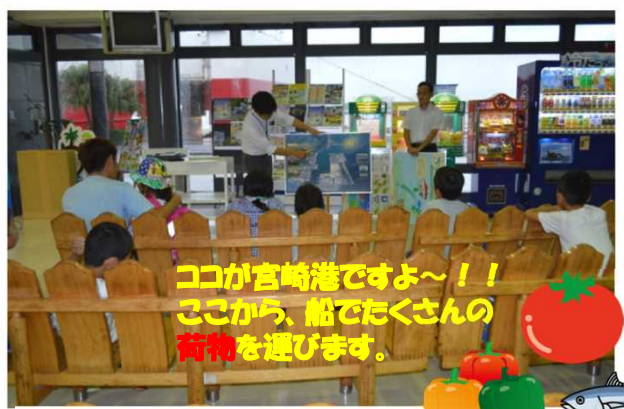
ココが宮崎港ですよ〜！！ ここから、船でたくさんの荷物を運びます。

パネルを使っての、みなとの説明に生徒のみなさん、興味津々で身を乗り出して話をきいてくれました。♪♪