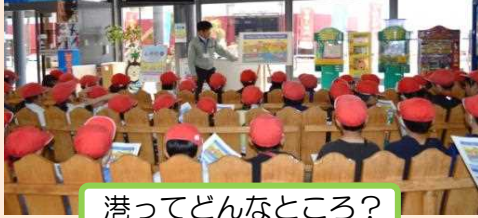
港ってどんなところ？