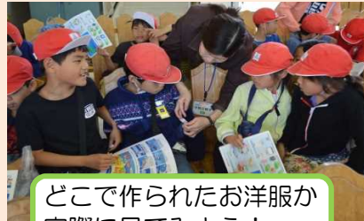
どこで作られたお洋服が 実際に見てみよう！