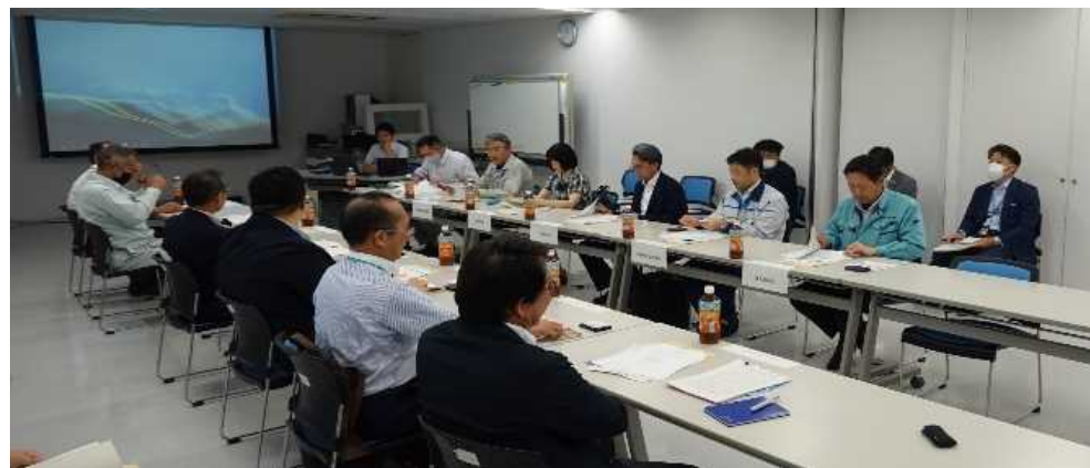
協議会の開催状況