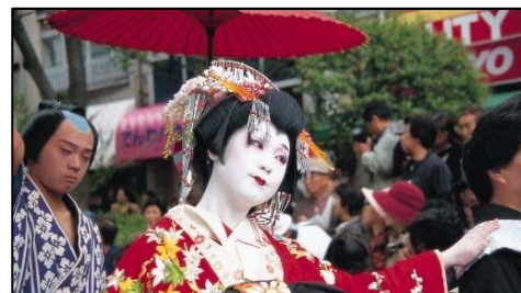
しものせき海峡まつり