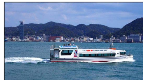
関門海峡遊覧クルージング