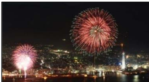
関門海峡花火大会