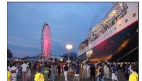
客船おもてなしイベント