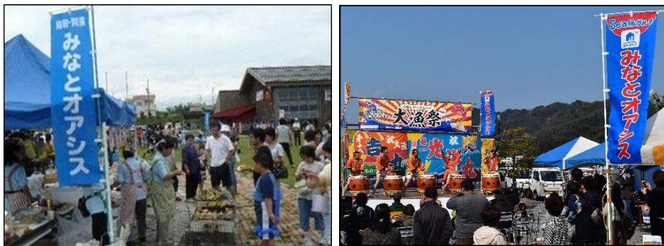
「みなとオアシス」における地域振興イベント