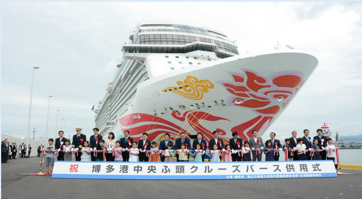
式典出席者によるテープカットの様子 ※船は博多港に寄港中の「ノルウェー・ジャン・ジョイ」