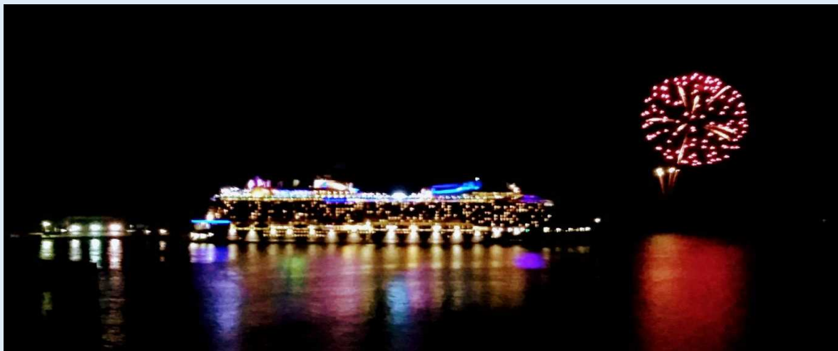
油津港出港時の「クァンタム・オブ・ザ・シーズ」