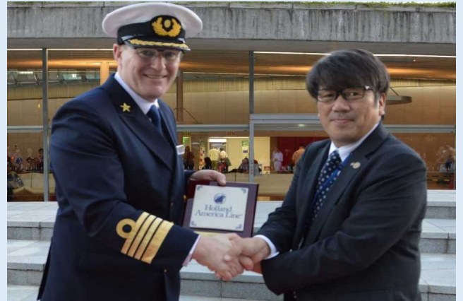
記念品贈呈の様子