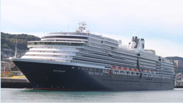
「ウエステルダム」（長崎港）

長崎港では歓迎式典が催され、同船船長から長崎市関係者へ記念品が渡されました。バスツアーの乗客は平和記念公園、原爆資料館や稲佐山展望台などの観光地を巡りました。また、個人で観光した乗客も多数おり、主に長崎市内の観光地を訪れたようです。