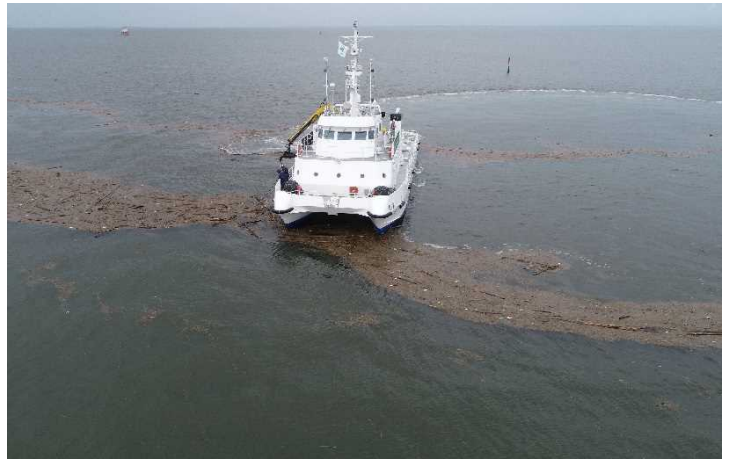
〔海輝による漂流物回収〕