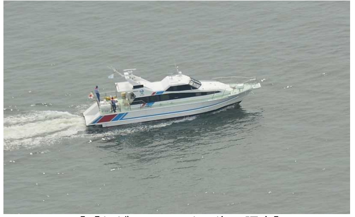
〔「かがしま」による海面調査〕