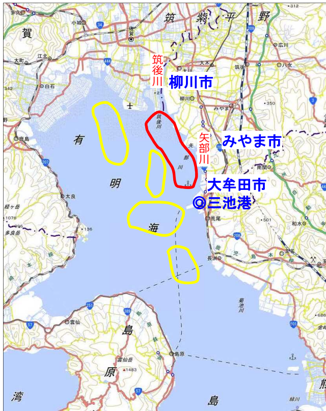
〔漂流物回収ポイント〕