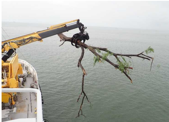
〔海煌による漂流物回収〕