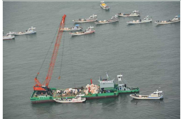
〔9月3日災害協定団体及び漁業者との連携回収〕