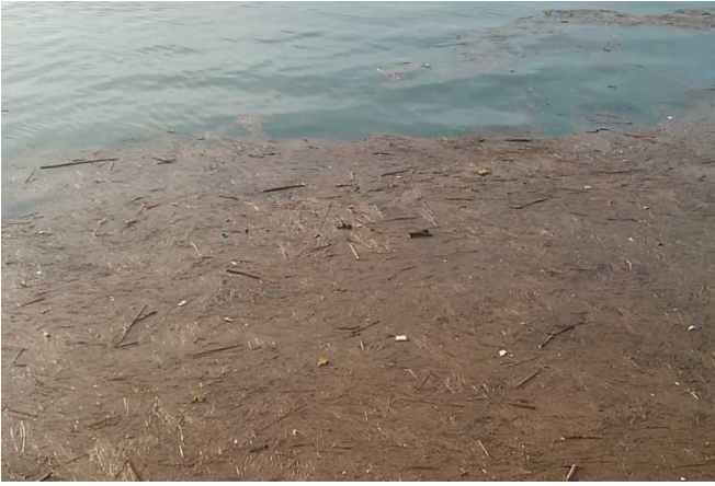
〔漂流物の状況（三池港沖）〕