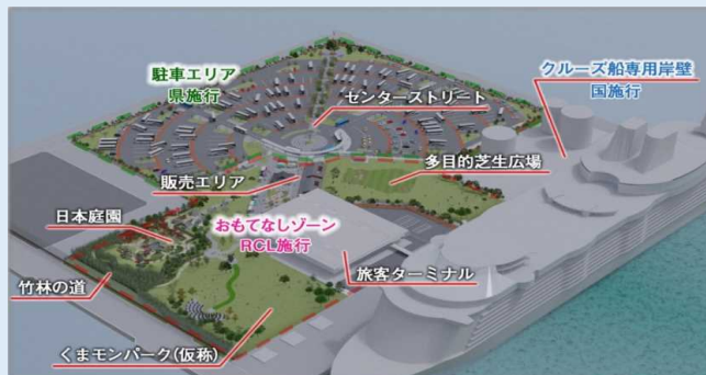
八代クルーズ拠点完成イメージ

決定した愛称は、八代港クルーズ拠点の広報やポートセールス等のPRに活用するほか、道路案内標識等、一般に広く使用されるとのことです。