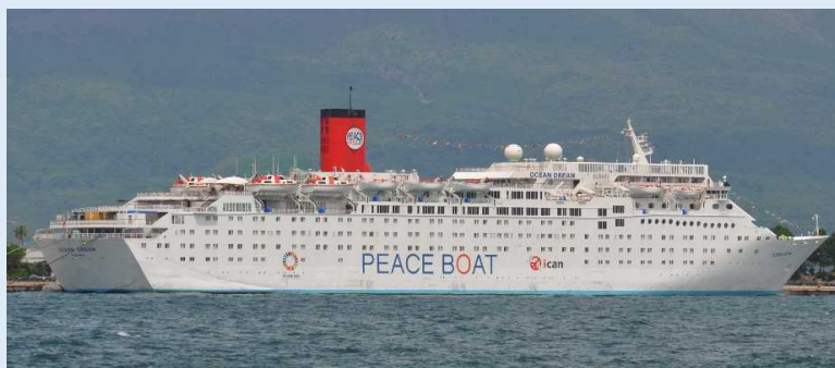
オーシャン・ドリーム（鹿児島港）

本船は2019年8月4日～8月23日の20日間、日本一周クルーズを行いました。同社が日本一周クルーズを行うのは30年ぶり、夏休み期間に合わせて開催されました。大阪発、神戸着で、途中、鹿児島港に寄港したほか、長崎では軍艦島クルージング、北海道では知床半島クルージングが企画されました。