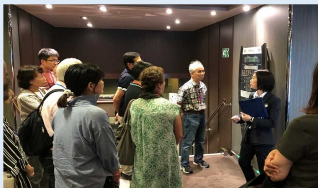
船内見学会の様子

本見学会は、2023年の国際クルーズ拠点供用開始に向け、市民の方々にMSCクルーズ社及び長州出島の取り組みについて理解を深めてもらうために下関市が企画したもので、参加者は普段見る機会のない船内の様子を楽しみました。また、岸壁ではベリーダンスや平家太鼓の演奏が披露され、出港時には市民による見送りが行われました。