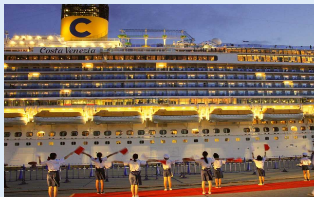
手旗信号による見送り