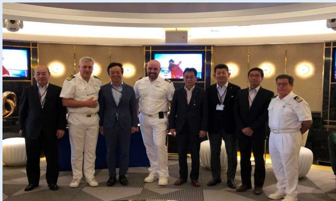
歓迎セレモニーでの記念撮影の様子

2019年8月11日、イタリアのコスタクルーズ社が運航する「コスタ・ベネチア」（総トン数135,500トン）が乗客約5,166人を乗せて下関港に初寄港しました。船内では、初寄港の歓迎セレモニーが開催され、下関市長をはじめ地元関係者らが出席し、同船船長らに記念品や花束が贈呈されました。出港時には、船がライトアップされ、下関海洋少年団の手旗信号による見送りが行われました。