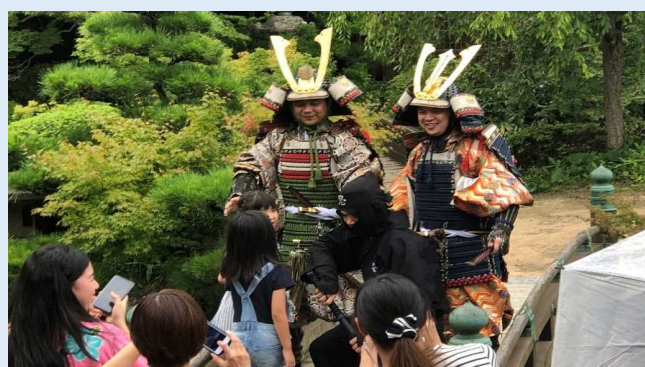
着付け体験の様子