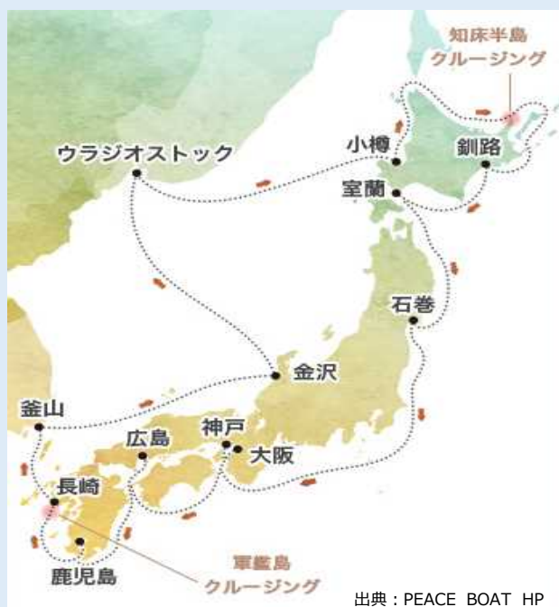
日本一周クルーズ寄港地