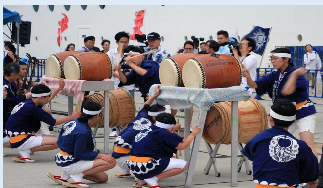
平家太鼓演奏の様子