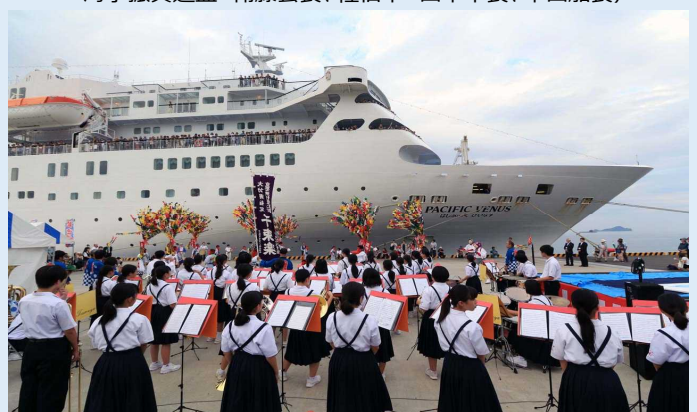
地元学生による吹奏楽の演奏