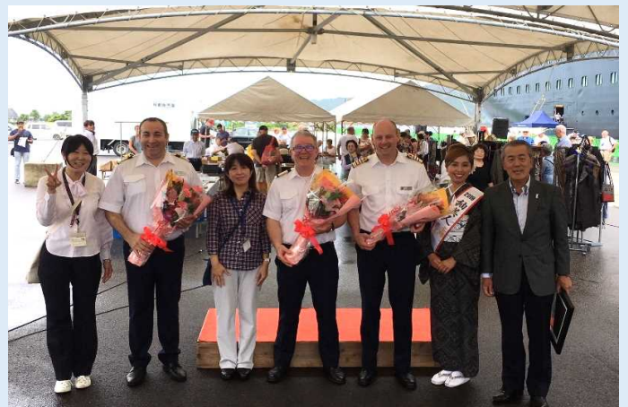
歓迎セレモニー記念撮影の様子