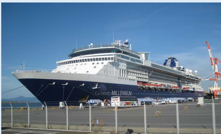
セレブリティ・ミレニアム (北九州港)