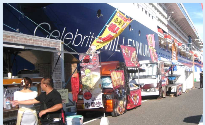
岸壁における出店の様子