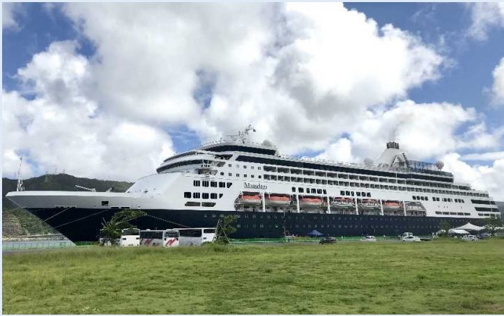
マースダム (名瀬港)

2019年9月3日、米国のホーランド・アメリカラインの「マースダム」(総トン数55,575トン)が乗客約1,109人を乗せて、名瀬港に初寄港しました。乗客の8割以上が欧米やオーストラリアからの乗客で、到着後、初寄港を記念して歓迎セレモニーが行われ、大島紬をあしらった記念の盾が船社へ贈られました。岸壁では特産品の販売や、通訳ボランティアによる観光案内が行われ、乗客らは名瀬市街地を散策したり、島内観光に出かけました。