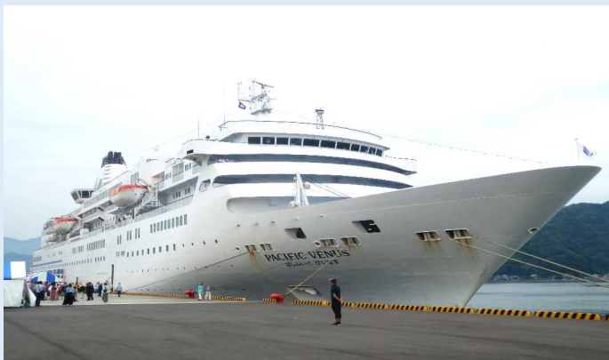
ばしふいっくびいなす (佐伯港)