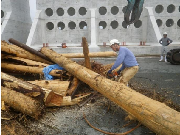
[7月7日 陸揚げした流木の切断作業]