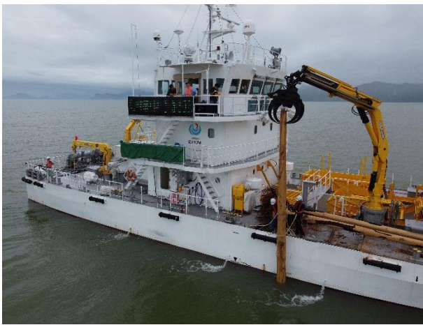
[7月5日 海輝による流木回収]