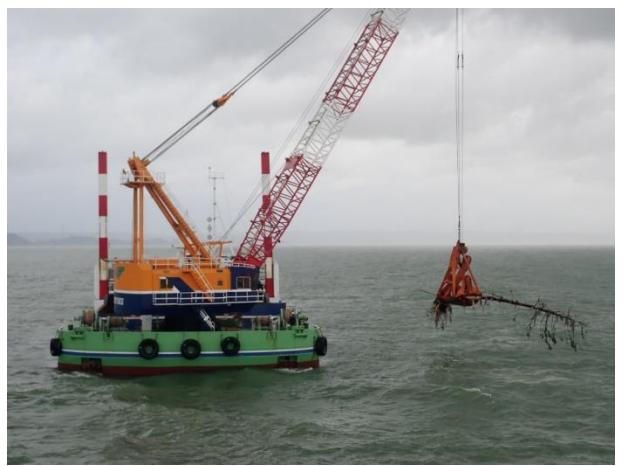
[7月6日 支援台船による流木回収]