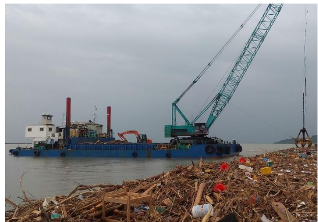
[7月10日 支援台船による漂流ごみ回収]