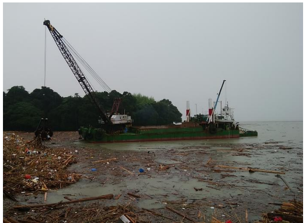
[7月9日 支援台船による漂流ごみ回収]