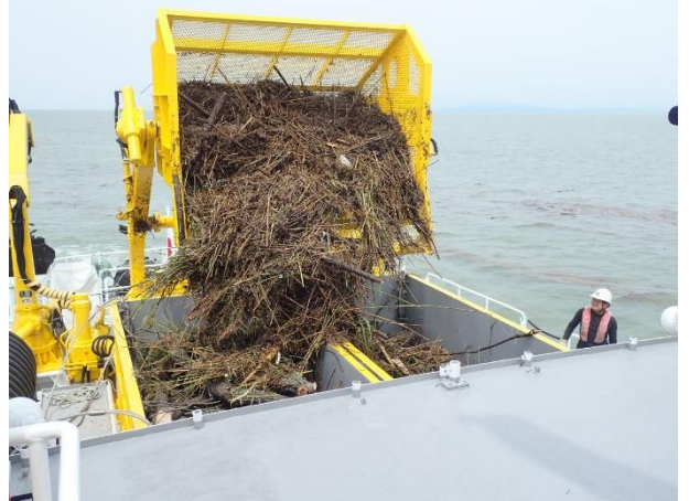
[7月8日 海輝による漂流ごみ回収]