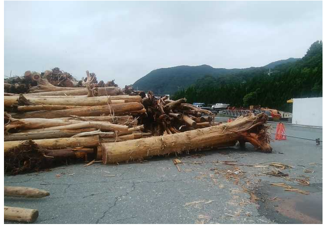
[7月12日 陸揚げした流木]