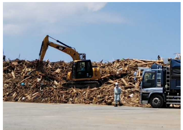
[7月17日 陸揚げした漂流ごみ]