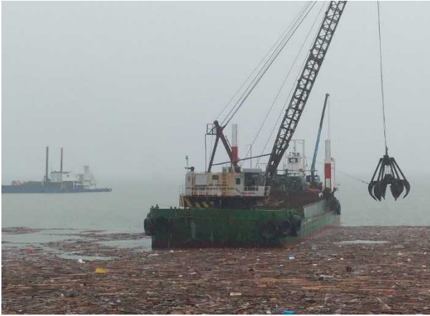
[7月11日支援台船による漂流ごみ回収]