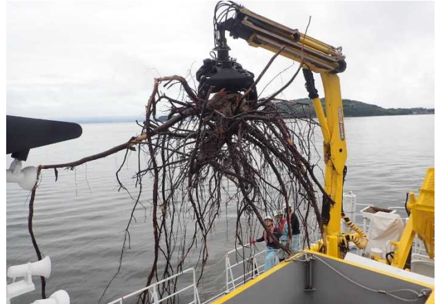
[7月16日 海輝による流木回収]