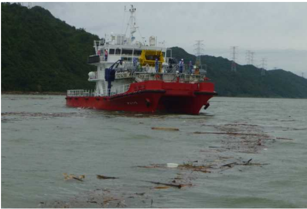
[7月13日 がんりゅうによる漂流ごみ回収]