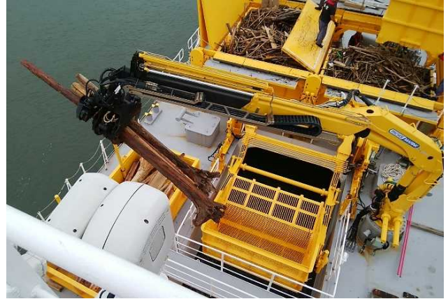
[7月15日 海煌による流木回収]