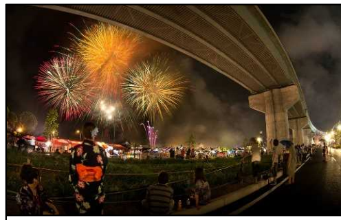
させぼシーサイドフェスティバル