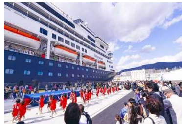
クルーズ客船歓送迎行事