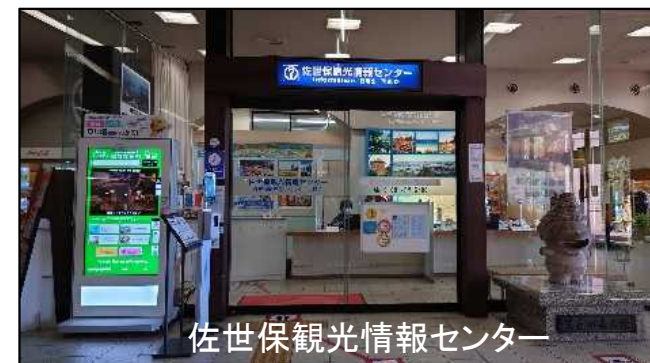
佐世保観光情報センター