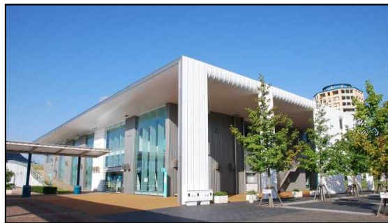
新みなとターミナル