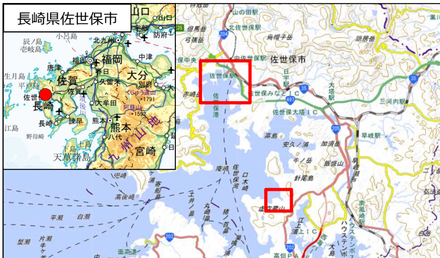
国土地理院地図（電子国土Web）( https://maps.gsi.go.jp )をもとに作成