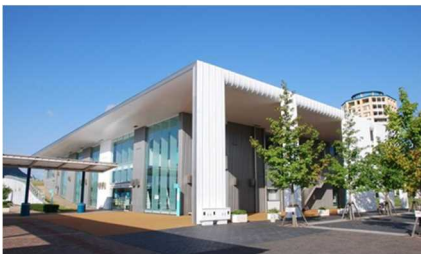
新みなとターミナル