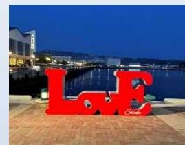
ハーバーテラス SASEBO迎賓館

市民が集い楽しむ地域コミュニティの場として、また市外からの観光客等を迎える玄関口として、「人と街をつなぎ、心を結ぶ」をコンセプトとしたウォーターフロントの大型商業施設として平成25年に開業し、海辺の賑わいにつながっています。