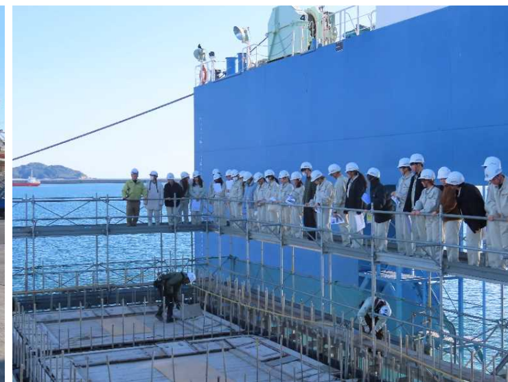
ケーソン製作現場