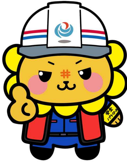
①安全確認を行うししまる（その1）