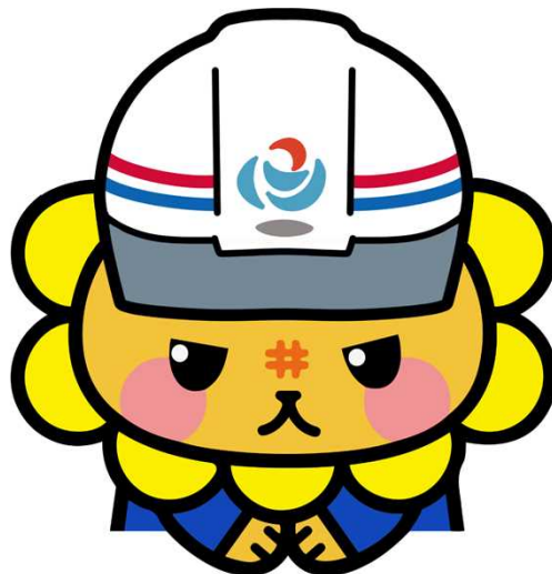
⑧工事のご協力をお願いをするししまる（その1）