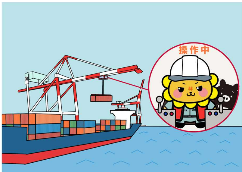
⑥ガントリークレーンを使ってコンテナを船から下ろすししまる