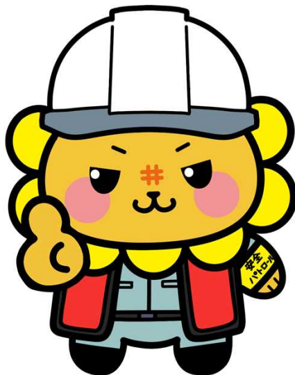
②安全確認を行うししまる（その2）