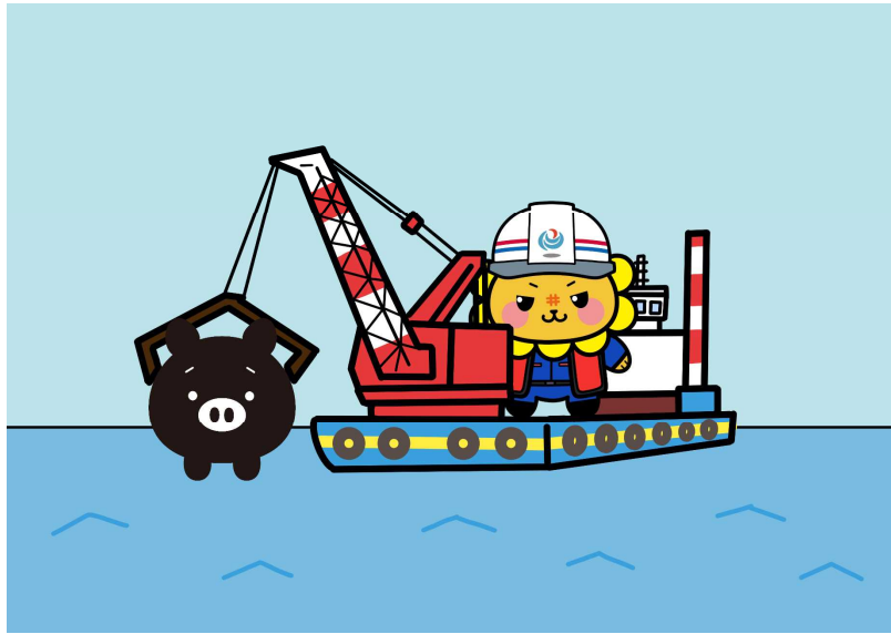
⑤作業船（起重機船）を使って港湾工事を行うししまる