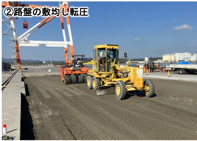
②路盤の敷均し転圧