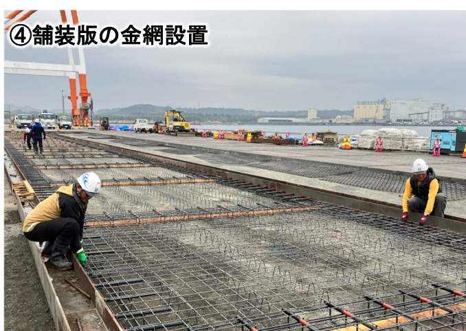
④舗装版の金網設置