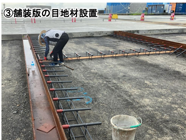
③舗装版の目地材設置