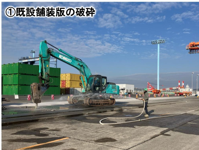
①既設舗装版の破碎