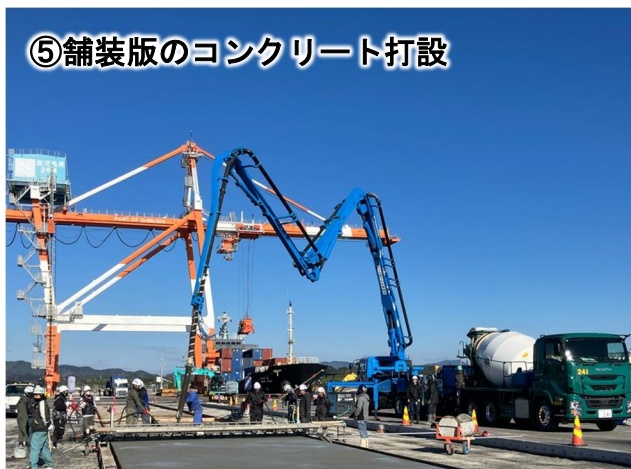
⑤舗装版のコンクリート打設