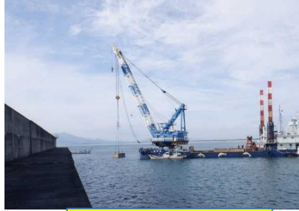
⑤根固めブロック設置