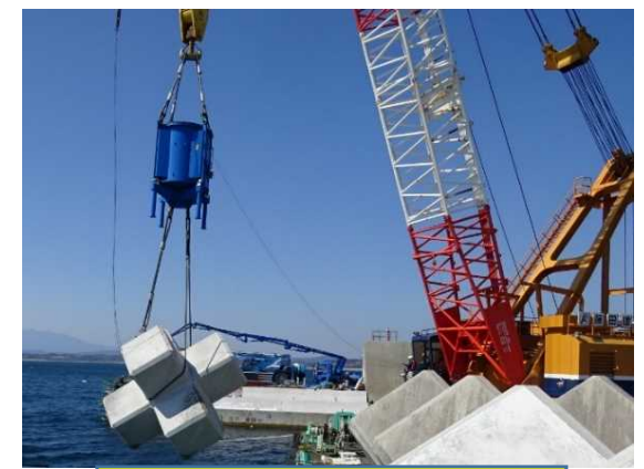
⑥消波ブロック据付