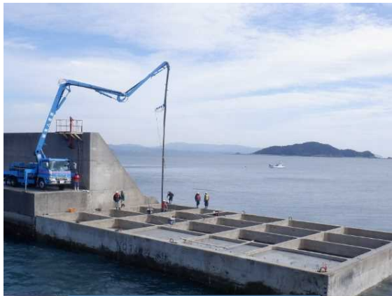
④コンクリート打設