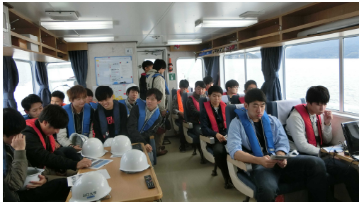
船で徳山下松港を見学する様子