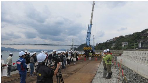
下関港海岸見学の様子