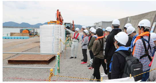
工事現場見学の様子