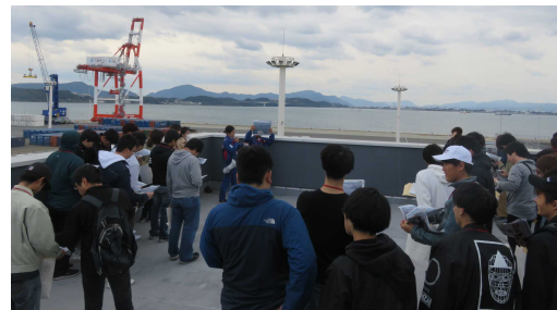
長州出島見学の様子