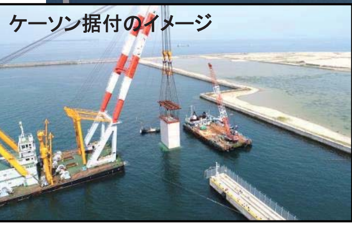
ケーソン据付のイメージ